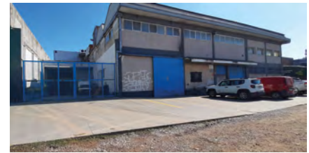
Imágenes de algunos de los distintos establecimientos relevados y mapeados por el estudio.

mites urbanos de la ciudad de Mar del Plata, así como también, su parque industrial y alguna de sus localidades y parajes próximos. El primero de ellos (FIGURA 1), corresponde a los resultados obtenidos en el Censo Nacional Industrial Pesquero del año 1996 y el segundo (FIGURA 2), corresponde a los resultados obtenidos por la Secretaría de Desarrollo productivo del Partido de General Pueyrredón en el año 2018.